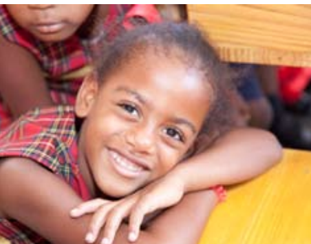
Une élève dans une salle de classe modulaire