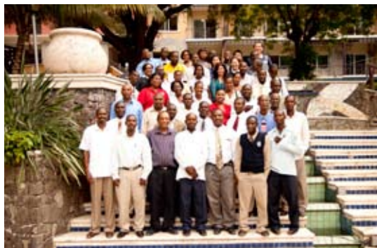
Des professeurs lors du Prix de l'Ecole de l'Année