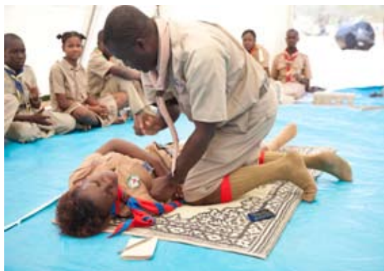
Formation de secours et soins des scouts

Le programme de trois ans pour supporter les 20 premières écoles construites par la Fondation en 2007/08, continua avec quelques petits retards. Les directeurs d'écoles ont subi une formation supplémentaire en administration, améliorant leurs compétences en ressources humaines, finance et prévision budgétaire. 124 professeurs ont assisté au programme d'été de formation résidentiel. Des ouvrages scolaires ont été fournis aux écoles, ainsi qu'un traitement fixe pour supporter les salaires des professeurs.