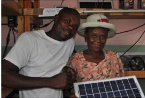
Magasin d'énergie propre