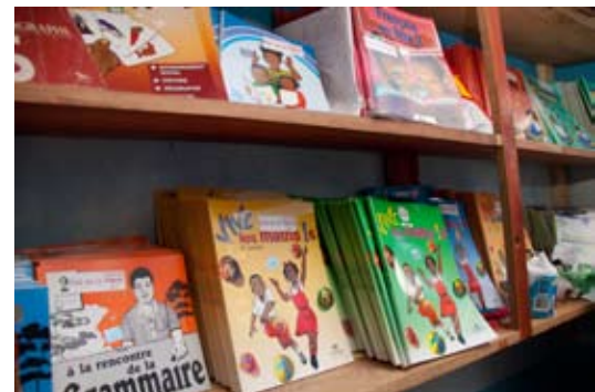
Distribution de livres