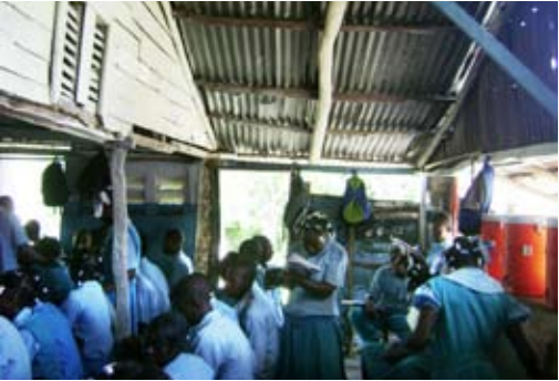
Saut d'Eau 2007