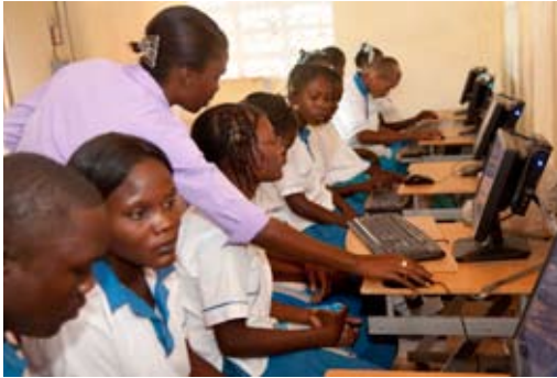
Saut d'Eau IT Lab 2011