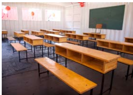
Intérieur des salles de classe modulaires

Les écoles définitives furent conçues par un ingénieur en génie civil et complètement mis à l'épreuve dans des simulations sismiques. La Fondation fournit support et supervision aux entrepreneurs pour s'assurer de l'exécution correcte des plans. Parmi les écoles il y a une en association avec "Special Olympics" pour offrir une éducation aux enfants ayant des besoins spéciaux, deux sur une île sur la côte sud et une dans un camp d'hébergement. La majorité des écoles sont complétées dans les quatre mois qui suivent le début de la construction.