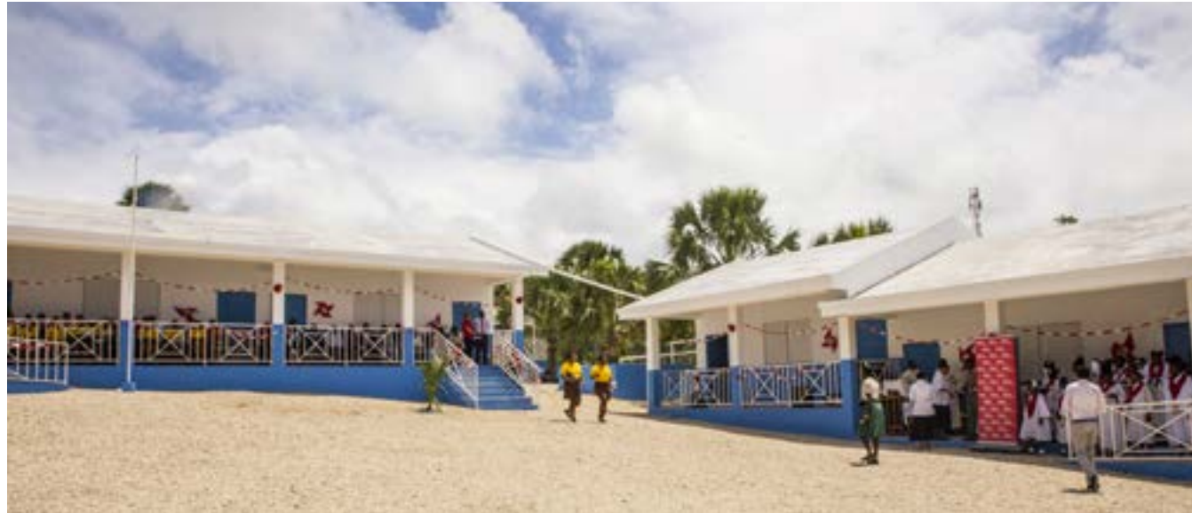
École Nationale Congréganiste de Bainet

Au terme de cet exercice fiscal les deux autres établissements étaient en phase de finition, il s'agit de : l'École Nationale de Cotton à Jean Rabel dans le Nord-Ouest et le Collège Saint Louis Marie de Montfort à Delmas 31 dans le département de l'Ouest.