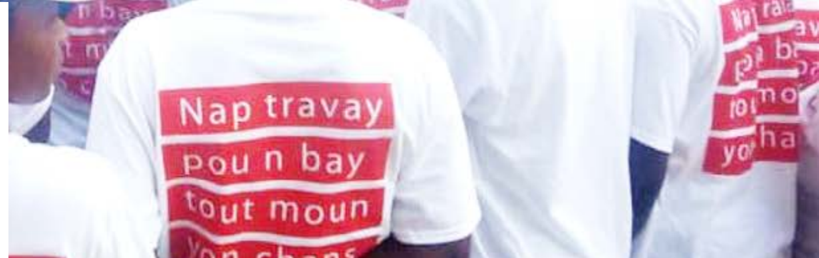
Excursion avec les professeurs sur les sciences expérimentales à Saut Mathurine, Camp Perrin

Après dix années, notre programme de développement professionnel a été bonifié. De nouvelles thématiques ont été abordées, de nouveaux modules ont été ajoutés pour répondre au mieux aux exigences de l'apprentissage moderne. En effet, la Fondation Digicel, en partenariat avec le Ministère de l'Éducation Nationale, a mis sur pied le « Projet d'appui au renforcement des capacités des communautés scolaires pour une éducation de qualité (PARCCSEQ) », qui sera intégré dans soixante-quinze (75) de nos