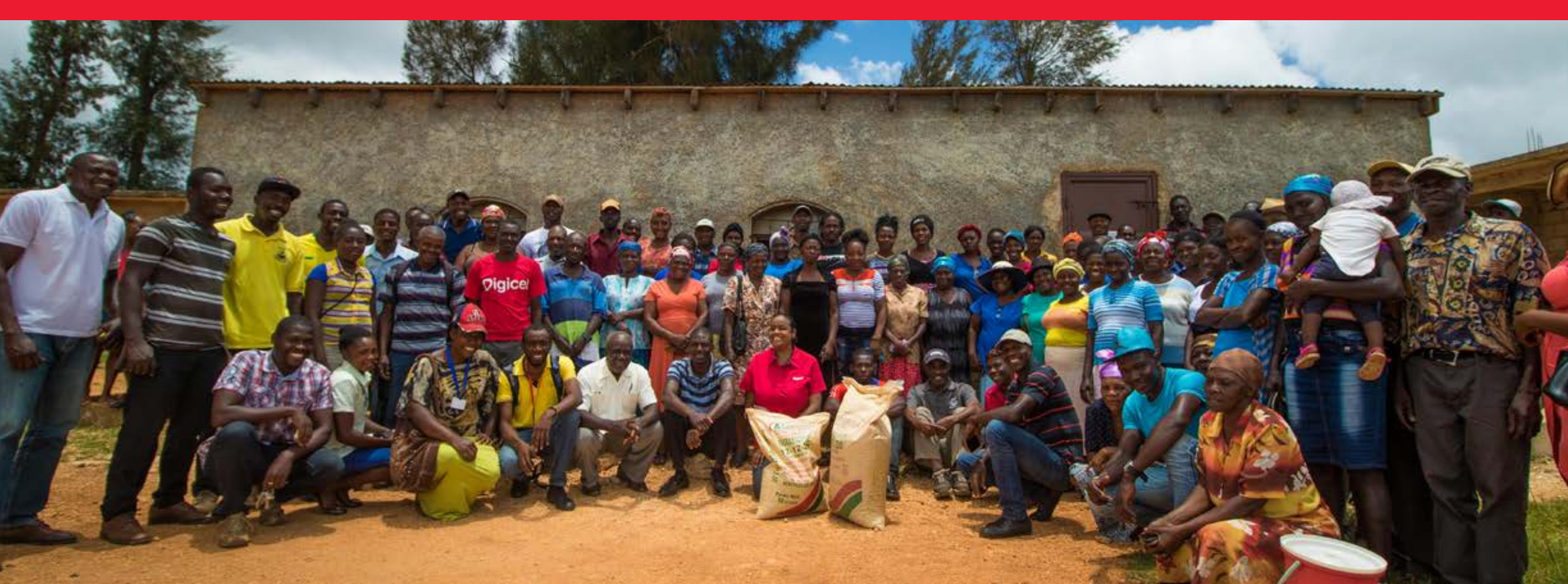
Membres de l'organisation PAVODEV