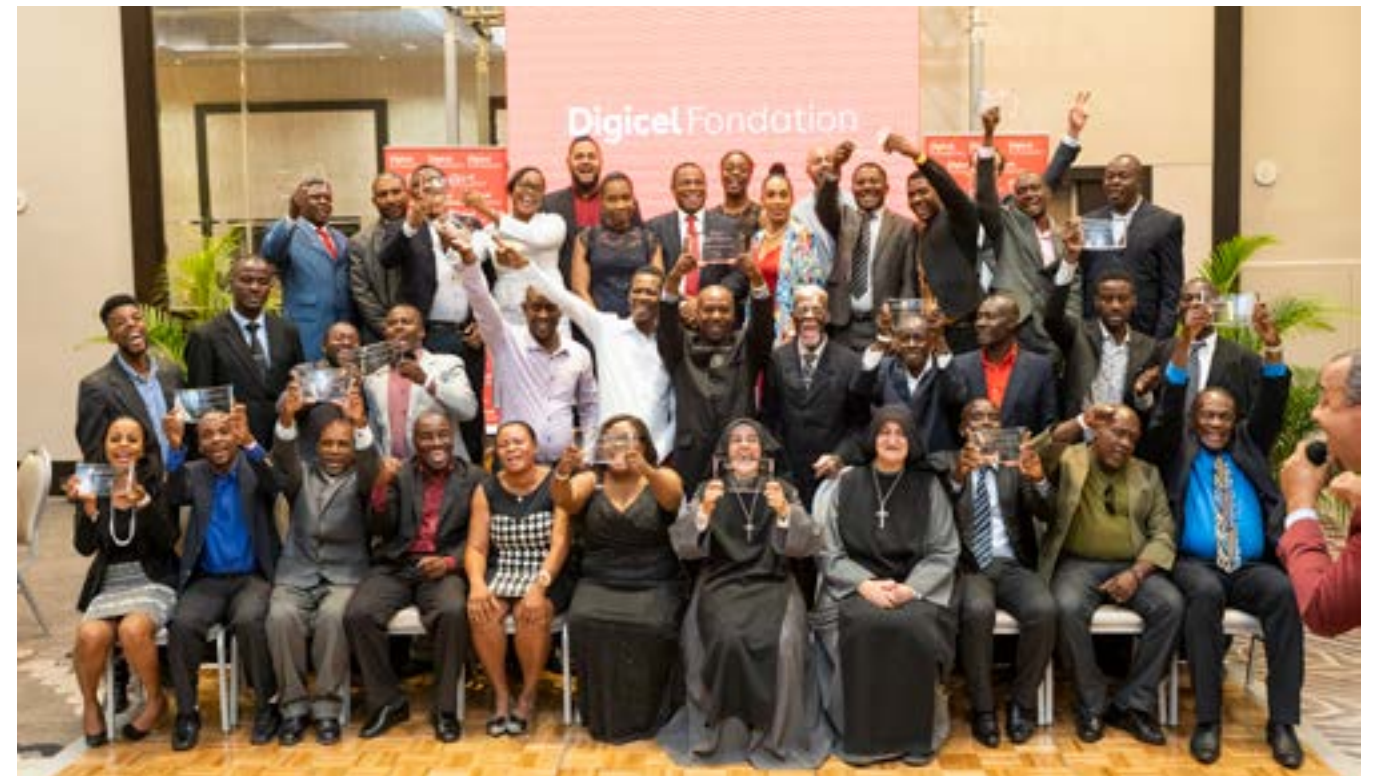
Les gagnants de Konbit pou Chanjman avec les membres du conseil de la Fondation à la cérémonie de remise des prix