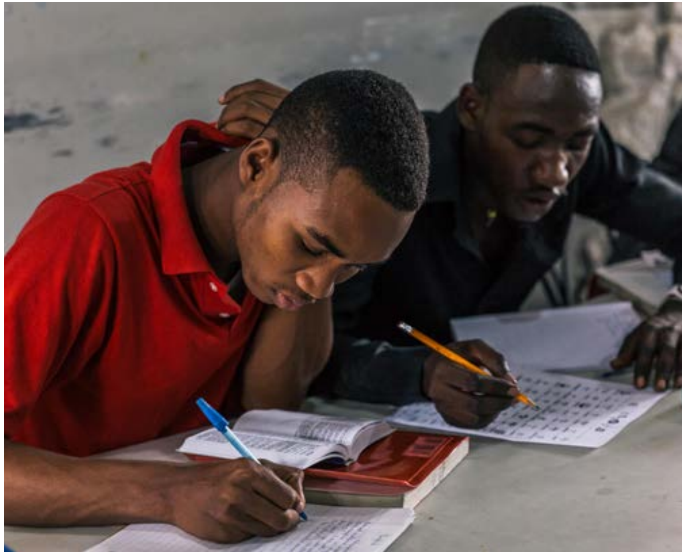
Boursiers de HELPR