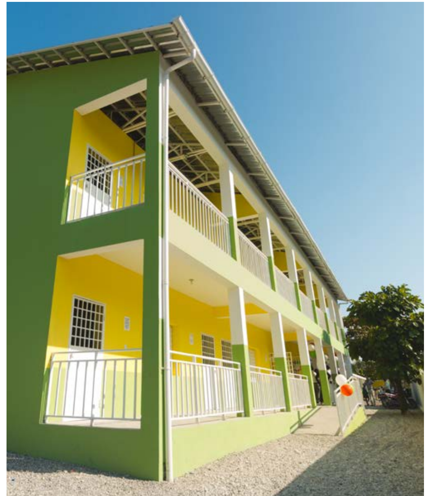
Centre d'Etudes de Gamaliel