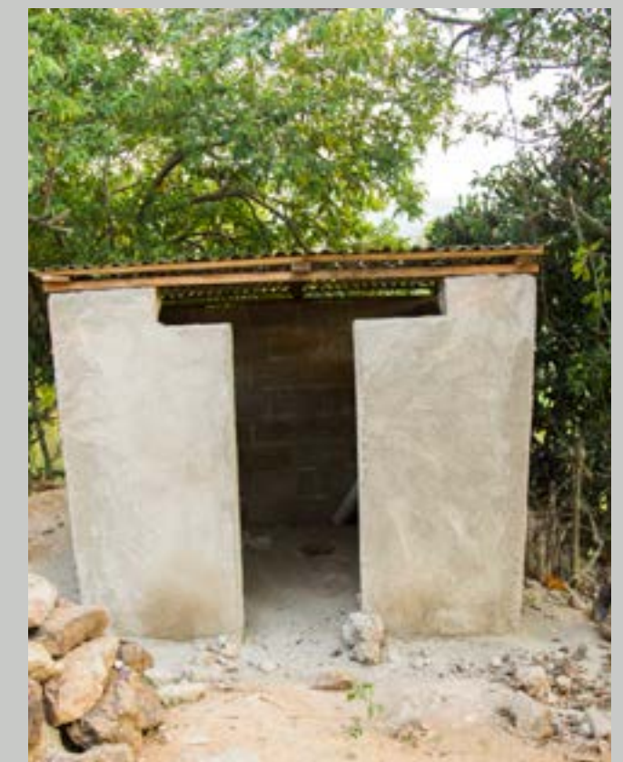
Après (En construction)