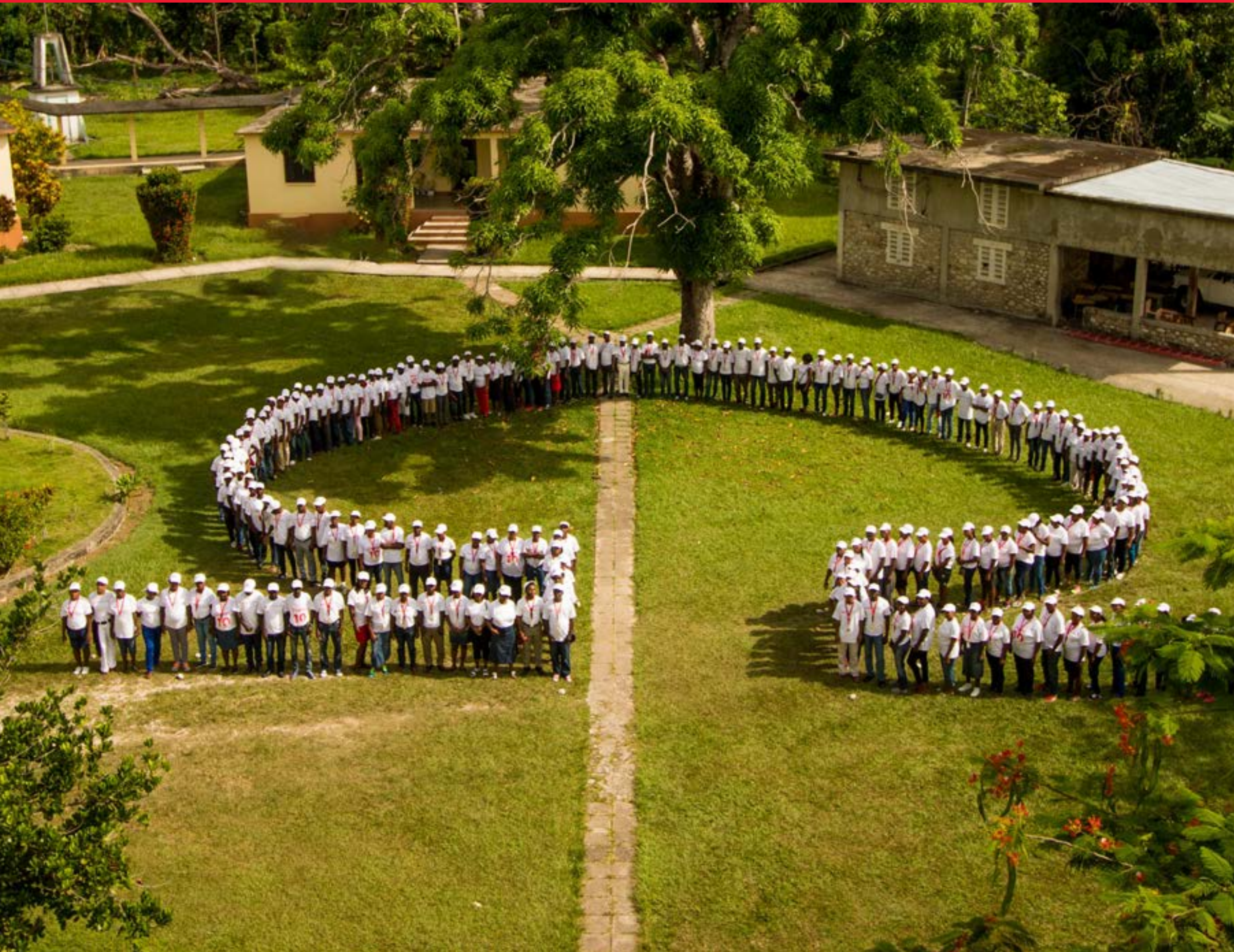
Les professeurs au Centre Mazenord de Camp Pérrin

écoles sélectionnées à cet effet. Ce projet traduit notre vision d'autonomisation des communautés car il a pour principal objectif d'aider à la mise en place de structures participatives telles des comités de gestion des écoles. Lors de la phase préparatoire, des séances de formations sur la gestion communautaire, les projets de développement des écoles, la maintenance des établissements et autres ont été délivrés par les spécialistes du Ministère de l'Éducation Nationale à notre équipe de formateurs. D'autres sessions de formation sont à venir sur des thématiques telles : Elaboration et Gestion de projets, Supervision Pédagogique, Protection de l'Environnement, Secourisme, Gestion de conflits etc.