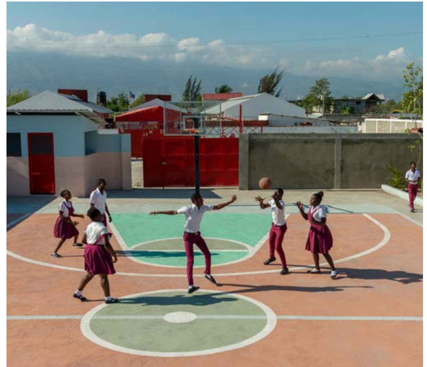
Collège Andrew Grene

La contribution de la Fondation Digicel dans le secteur éducatif haïtien est significative. Nous sommes heureux d'accueillir plus de 60,000 élèves dans les établissements scolaires que nous avons construits. Très bientôt, nous atteindrons la marque des 180 écoles construites et nous avons hâte d'y être .