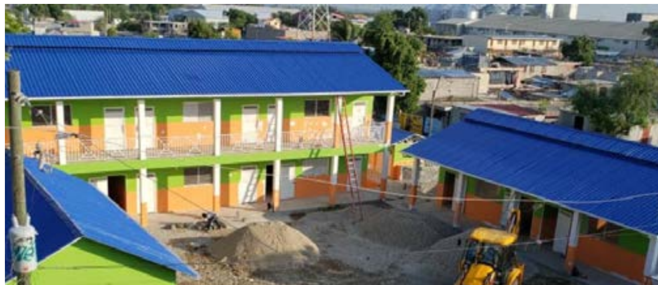
Collège Saint Louis Marie de Monfort

Andrew Grene, situé à Cité Soleil et construit en 2011, a bénéficié d'un terrain de basketball avec des gradins. Son financement a été assuré par notre partenaire de longue date, la Fondation Andrew Grene. Aujourd'hui, 249 écoliers fréquentant l'école sont ravis de leurs nouvelles installations et améliorent rapidement leurs compétences sur le terrain. L'institution Mixte Rescue One Child, également construite en 2011, a bénéficié d'un système d'électrification de ses locaux dans le but de soutenir principalement un nouveau laboratoire informatique